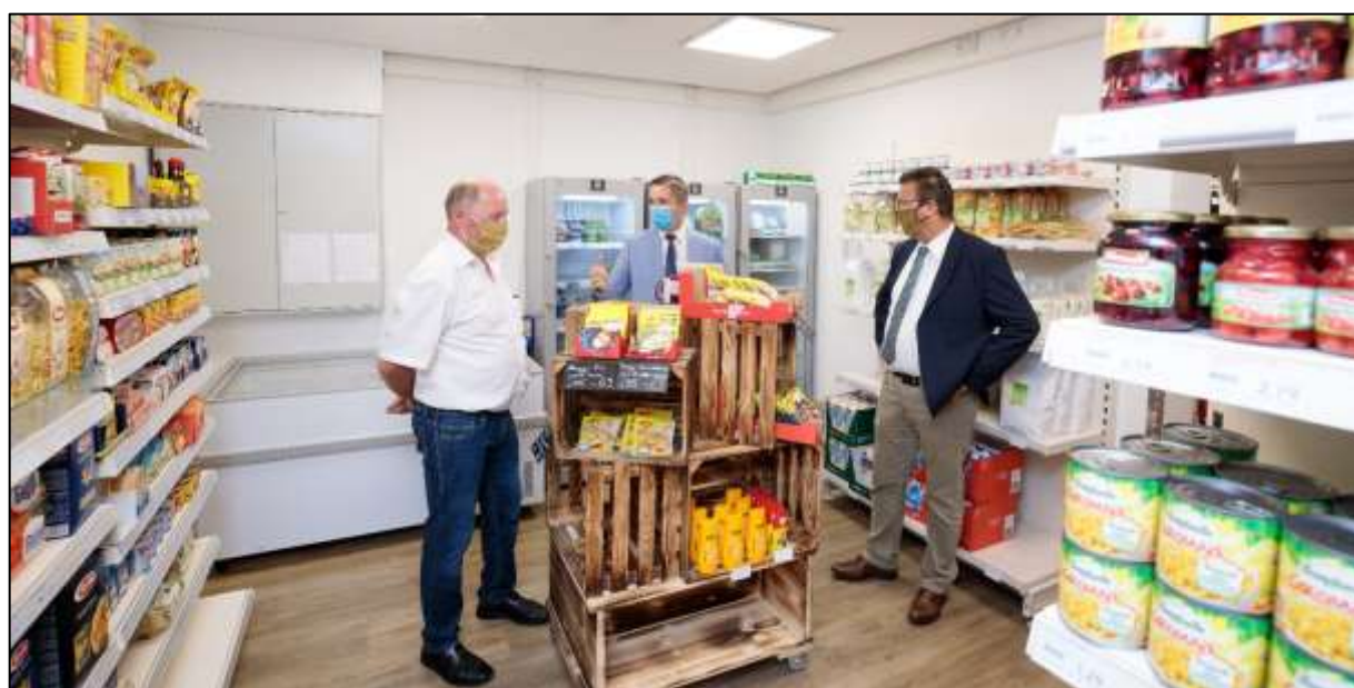
Abbildung 7: Minister Hauk (r.) mit Bgm. Julian Christ (Mitte) und Ortsvorsteher Guido Wieland (l.) im Dorfladen.

Ein besonders öffentlichkeitswirksamer Termin war der Besuch des Ministers für Ländlichen Raum und Verbraucherschutz, Peter Hauk (MdL), am 27. Juli im Gernsbacher Stadtteil Reichental. Bei dieser Gelegenheit besuchte er auch den über LEADER geförderten Dorfladen Reichental und betonte die große Bedeutung solcher von bürgerschaftlichem Engagement getragenen Projekte für den ländlichen Raum. Zahlreiche Pressevertreter begleiteten den Besuch und berichteten ausführlich darüber.