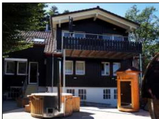
Abbildung 3: Wellnessbereich der „Black Forest Safari-Lodge“.

Auch die Projektumsetzung stand im Jahr 2020 unter den Vorzeichen der Corona-Pandemie. Bei vielen Projekten, insbesondere bei Bauvorhaben, hat sich die Umsetzung wegen Liefer-schwierigkeiten, oder weil Handwerker nicht wie geplant arbeiten konnten, verzögert. Hier mussten teilweise die Bewilligungszeiträume verlängert werden. Angesichts der hohen Anzahl touristischer Projekte aus den Bereichen Beherbergung und Gastronomie stand zu befürchten, dass einige der in den Vorjahren geförderten Projekte möglicherweise zum Aufgeben gezwungen sein würden, oder dass neu in 2019 und 2020 beschlossene bzw. bewilligte Projekte gar nicht erst umgesetzt werden würden. Diese Befürchtung hat sich erfreulicherweise bisher nicht bestätigt. Lediglich bei einem Projekt, das kurz vor Jahresende noch zurückgezogen wurde, waren die wirtschaftlichen Auswirkungen der Corona-Pandemie ein Grund neben anderen, die zum Rückzug des Projekts geführt haben. Projekte wie die Edelfuchs-Lodge, die Black-Forest-Safari-Lodge, die Räume für Kunst und Kultur im Arthotel „Das Waldhaus“ sowie der Abenteuer-Minigolf Mittelbaden am Mehrgenerationenpark Sinzheim wurden abgeschlossen.