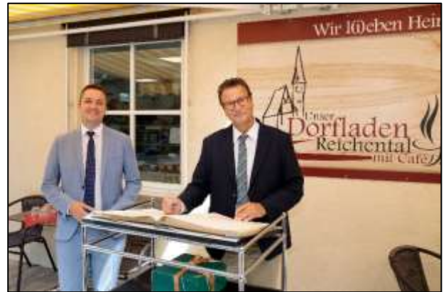
Abbildung 9: Der Minister trägt sich vor dem Dorfladen in das Goldene Buch der Stadt Gernsbach ein.

Die folgenden Bilder zeigen einige Impressionen von öffentlichkeitswirksamen Veranstaltungen im Jahr 2020: