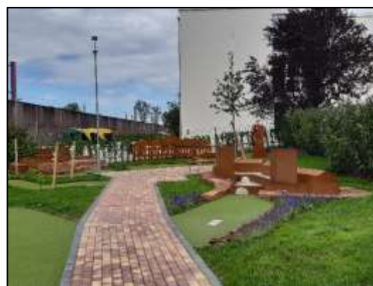
Abbildung 4: Erlebnisminigolf Sinzheim.